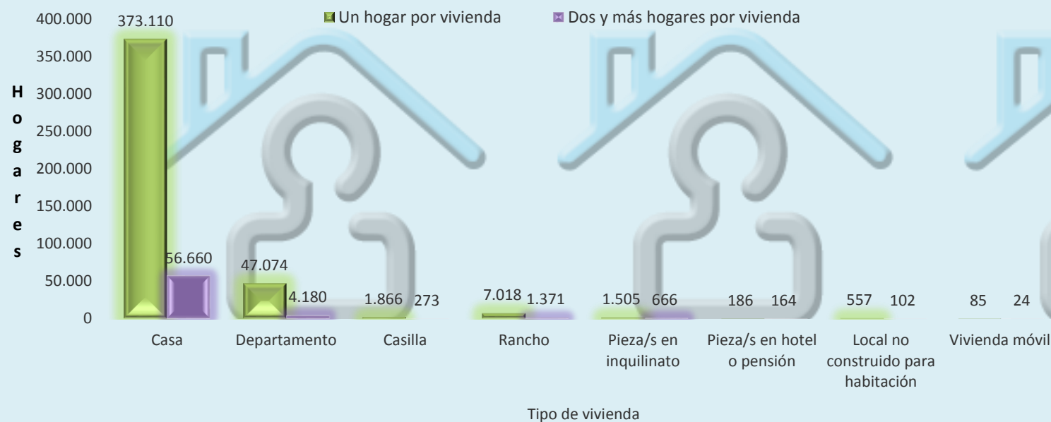
Hogares por tipo de vivienda según cantidad de hogares en la vivienda Mendoza. 2010